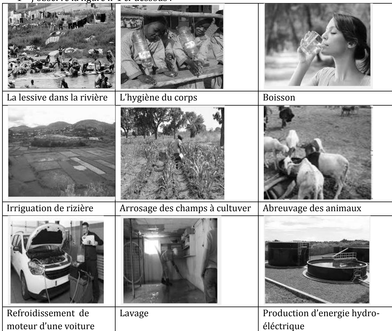
Figure1 : photo des usages de l'eau