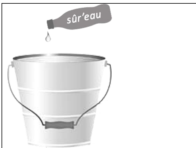
Figure n°3 Seau contenant de l'eau additionnée de sûr'eau Seau misy rano norarahana "sûr'eau"