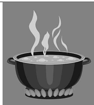
Figure n°4 Eau bouillante rano avy nampangotrahana.